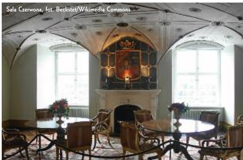
Sala Czerwona

głębsze warstwy tworzyły wzór. Niestety, zdobienia zostały usunięte w XIX wieku. Jeśli nie liczyć tego faktu, nieprzebudowywany zamek dotrwał w niezmiennym stanie do naszych czasów.