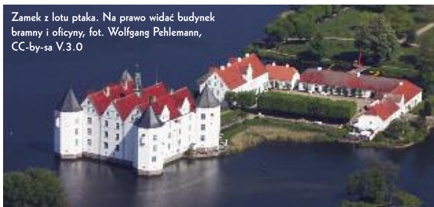
Zamek z lotu ptaka. Na prawo widać budynek bramny i oficyny, fot. Wolfgang Pehlemann, CC-by-sa V.3.0

Glücksburg leży na liczącym 600 km Niemieckim Szlaku Baśniowym, obejmującym miejsca związane z życiem i twórczością braci Grimm. ■