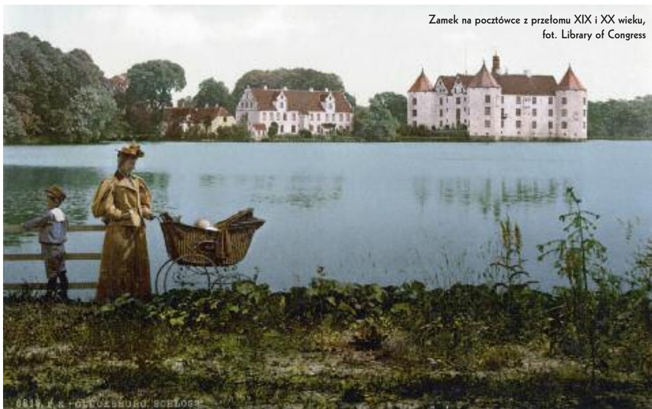
Zamek na pocztówce z przełomu XIX i XX wieku

Źródła z epoki wspominają, że z zewnątrz Glücksburg był ozdobiony typową dla budynków renesansowych techniką sgraffito, polegającą na nakładaniu na elewację kolejnych warstw tynku o kontrastowych barwach, a następnie zeskrobywaniu fragmentów wierzchnich przed ostatecznym utwardzeniem. Odsłonięte w ten sposób